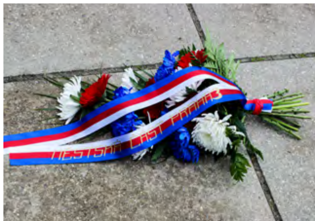
Kytice za městskou část Praha 3.