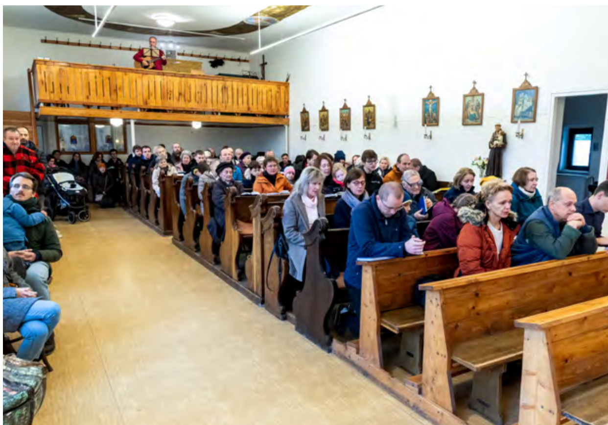
Interiér kostela sv. Vojtěcha.