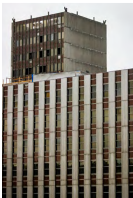
Stav komplexu budov v listopadu 2023.

Demolice telekomunikační budovy lidově zvané MORDOR v Olšanské ulici v roce 2024.