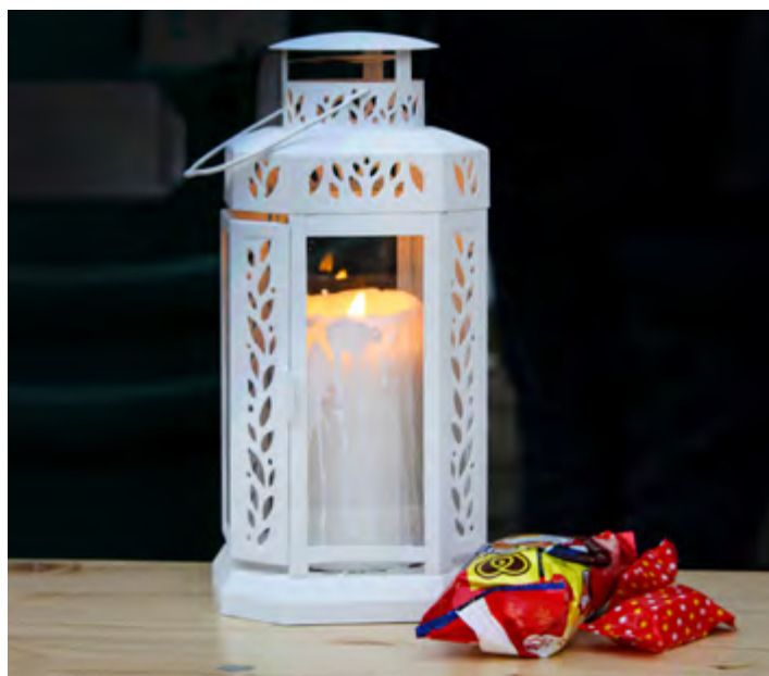
Betlémské světlo předávali skauti.