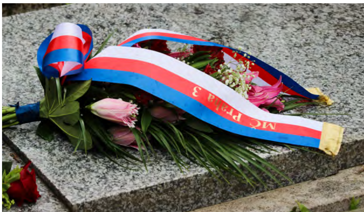
Smuteční kytice za městskou část Praha 3.