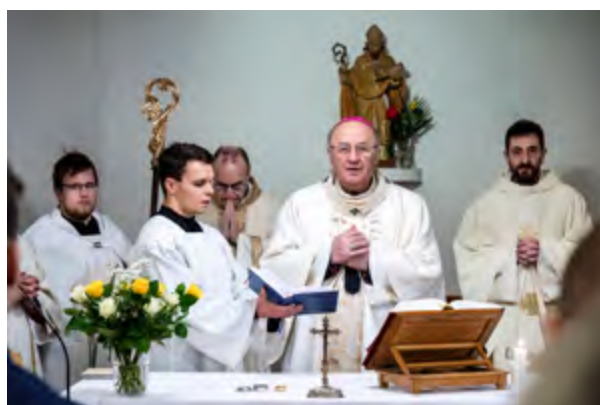
J. E. Mons. Jan Graubner.