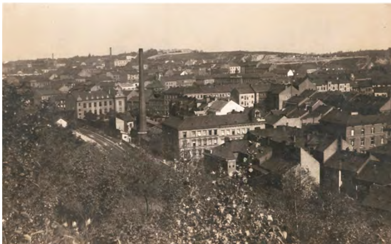
Pohled na žižkovskou elektrárnu z Vítkova. Historická pohlednice. Kolem roku 1900.