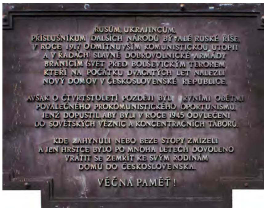
Pamětní deska na stěně chrámu Přesvaté Bohorodice.

V pondělí 25. března 2024 navštívila představitelka běloruské politické opozice v emigraci pražské Olšanské hřbitovy, aby uctila památku historických osobností Běloruska.