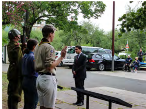
Uctění památky, položení květin.