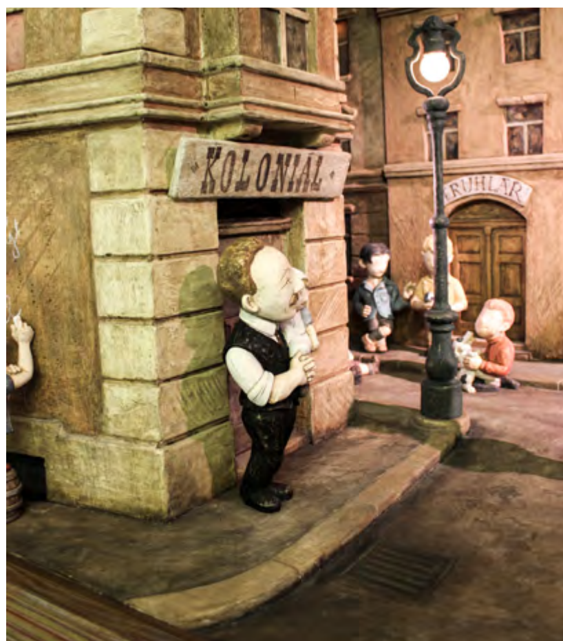
V tzv. žižkovském betlému přibyla před vánoci 2024 postava Přemysla Pitterra, zakladatele Milíčova domu na Žižkově.