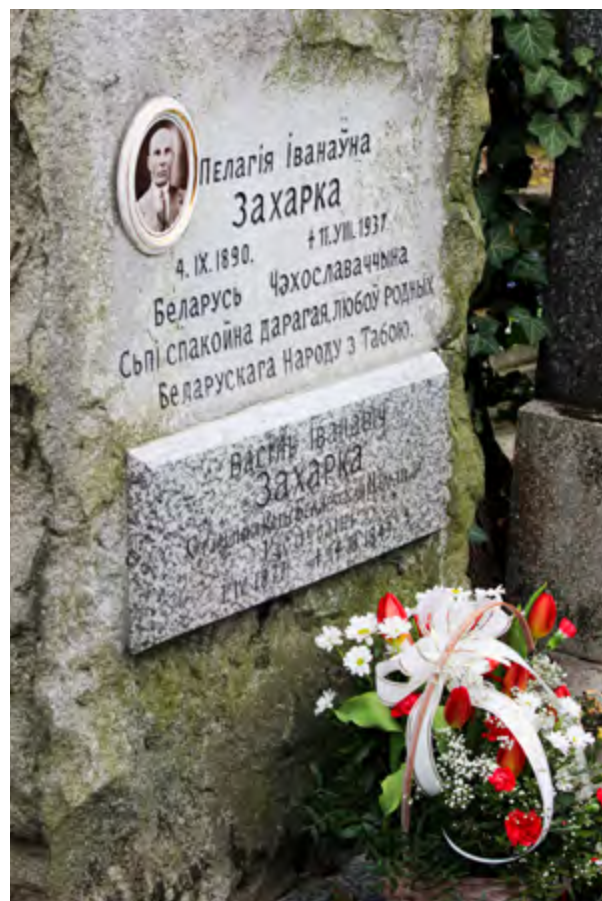
Hrob Vasila Zacharky.