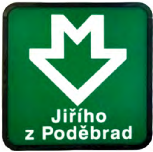
Poslední světelný button v původním designu s názvem a znakem stanice metra Jiřího z Poděbrad.