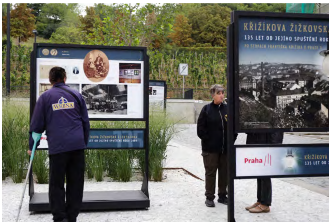
Tachovské náměstí s instalovanou výstavou.