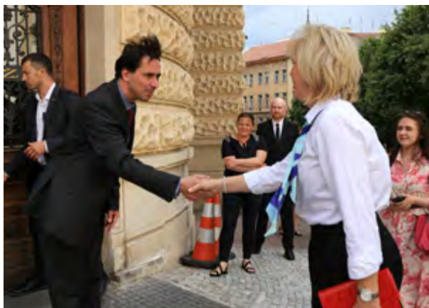
Uvítání starostou městské části Praha 3.

Manželka prezidenta republiky předala na žižkovské radnici ocenění 42 žákům škol, kteří prošli tréninkem v oblasti mediace.