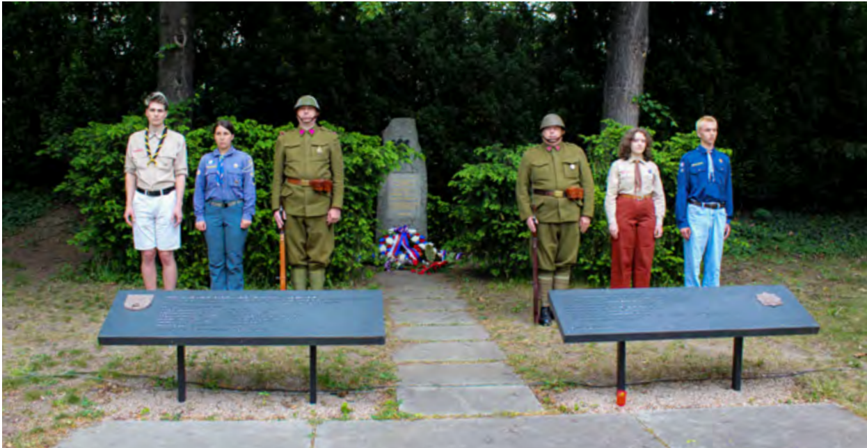
Čestná stráž u pomníku padlých.