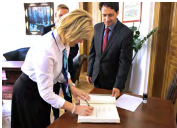
Zápis do Knihy návštěv.