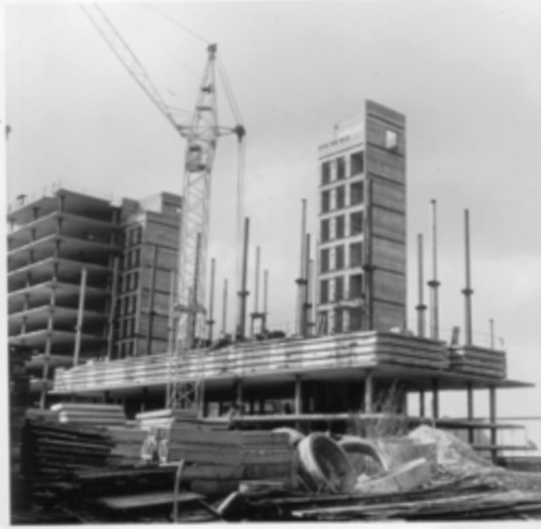
OLŠANSKÁ ul. - výstavba telekomunikační stanice - 1978