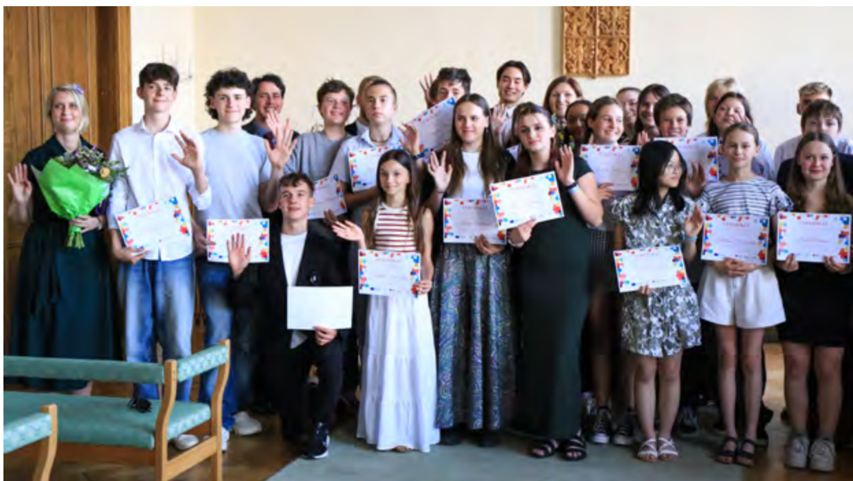
Oceněné žákyně, ocenění žáci.